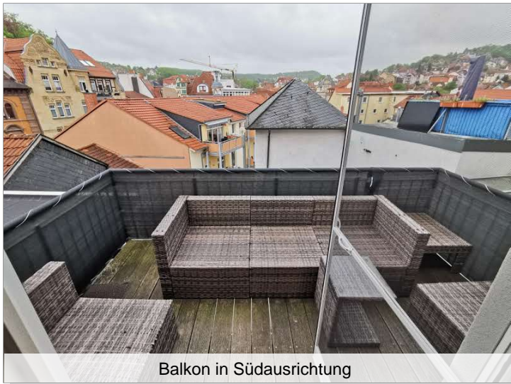
Balkon in Südausrichtung