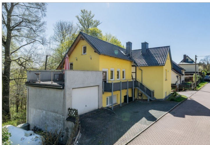
Ansicht - N