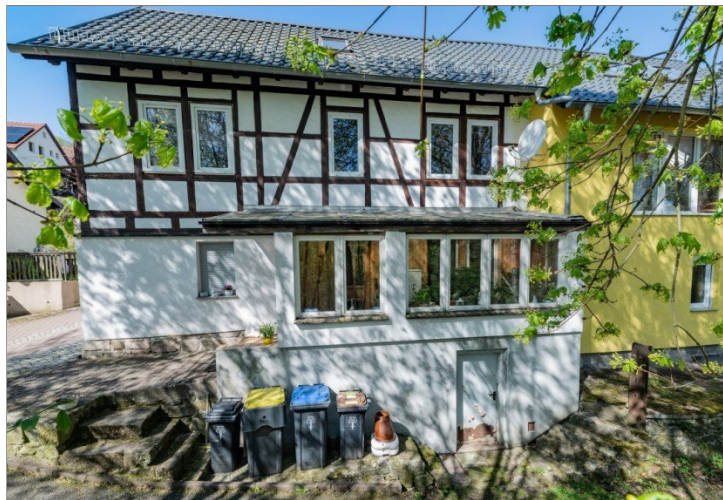
Ansicht - O