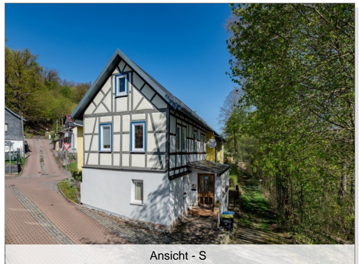
Ansicht - S